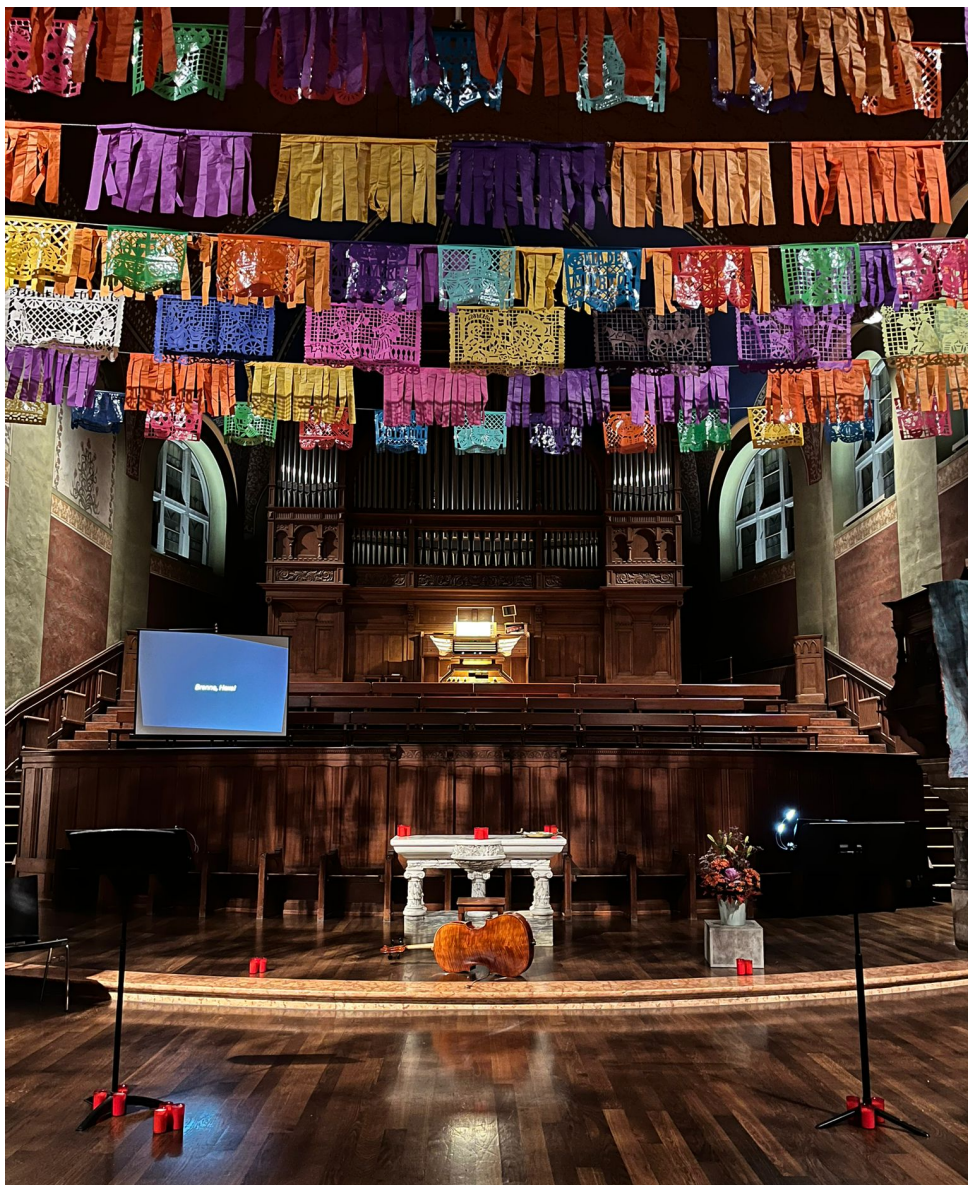
Photo prise par Michaël Rolli à la Citykirche Offener St. Jakob, Zurich

Captation vidéo : https://youtu.be/WW1E1a36hLI