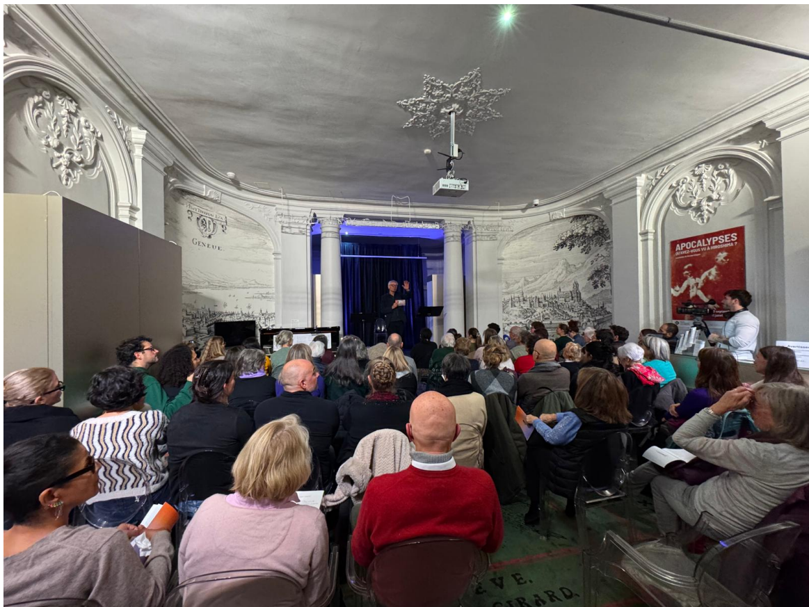
Le hall du Musée international de la réforme à la fin de notre représentation du 23 novembre 2025.

Cette rencontre a permis de prolonger les discussions autour du spectacle dans un cadre convivial, avec un apéro cocktail offert par le lieu. Elle a rassemblé un public nombreux, la représentation qui précédait l'échange ayant été annoncée complète deux semaines en avance.